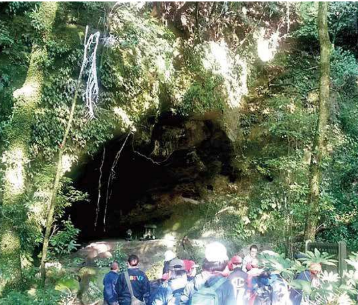
片野洞穴（森山小校区史跡めぐりの様子）