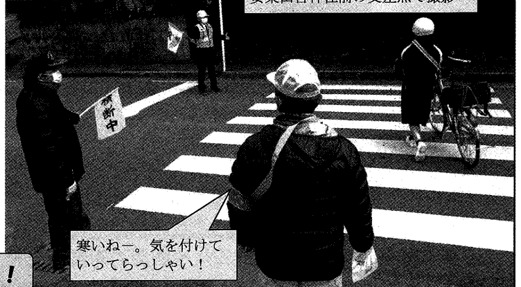
安楽山宮神社前の交差点で撮影

学校正門前や通学路の横断歩道では防犯ボランティアの皆さんが登校中の子どもたちに、あいさつすると「おはようございます」と元気よく返事が返ってきました。