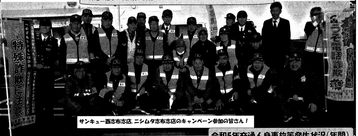
サンキュー西志布志店、ニシムタ志布志店のキャンペーン参加の皆さん!