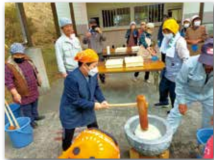
▲泰野校区で実施している餅つき体験の様子

この取組により、地域内に言葉や文化が共通する仲間が近くにいるという安心感が生まれるとともに、日本語を学ぶ機会の提供や地域の文化・習慣を知るためのオリエンテーションを行うことで、地域への理解が深まります。