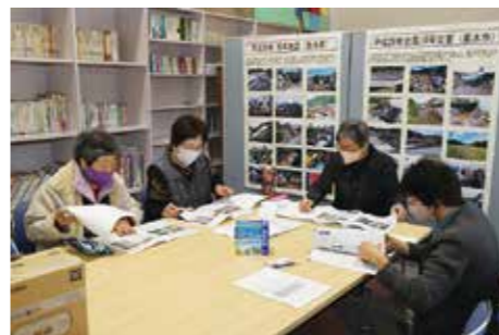
▲毎月集まり、担当するページを決めています