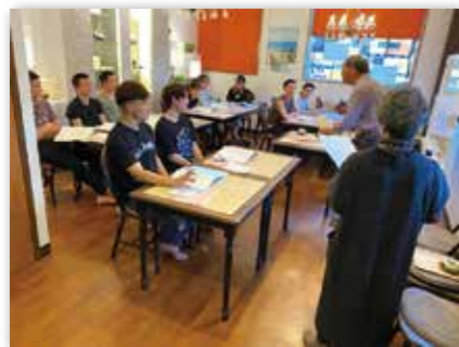
▲オリエンテーションのイメージ

泰野校区コミュニティ協議会では、地域に暮らす外国人が今以上に地域活動へ参加しやすい環境を整えるため、地域内の各企業・団体などの枠を越えて交流・連携ができる場を構築することを計画しております。