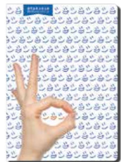
▲パンフレットは市役所内に設置の他、市HPでも電子版を公開予定です。

今回のパンフレットのキャッチコピーは「笑顔があふれるまちしずし」。全国の移住を考える方に手に取ってもらい、少しでも「志布志市に行ってみよう！住んでみたい！」と思えるきっかけになればと願っています。