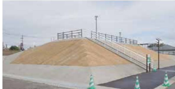
整備地：有明町野井倉 7996 番地 1 高さ：8.3m 避難可能人数：100 人