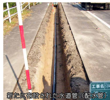
新たに布設された水道管(配水管)