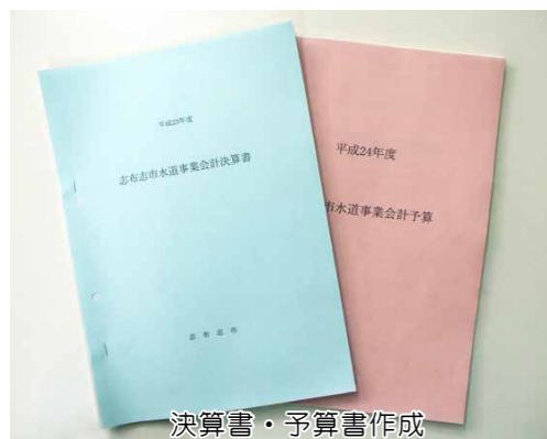
決算書・予算書作成

質問1 水道事業は水道料金で運営されていると聞いたのですが本当ですか。 回答1 水道料金を主な収入として水道事業(公営企業)※を運営しています。 具体的には、行政一般は市が税金や地方交付税などを主な収入として運営していますが、水道事業は、水道料金を主な収入とする企業(会社)運営ということになります。 これは水道事業の経営が、法律で「独立採算制」を求められているため、税金などで赤字補てんすることは避けなければなりません。 ※地方公共団体が経営する企業の総称で、水道事業、交通事業、病院事業など、人々の日常生活に欠くことのできない事業で大部分を占めています。 質問2 水道課はどんな仕事をしているのですか。 回答2 水道課には総務係、工務係、業務係の3つの係があります。各係の仕事は次のとおりです。