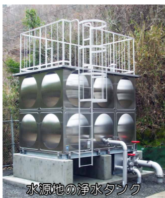
水源地の浄水タンク