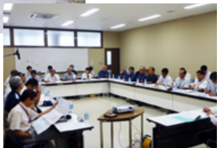
(右) 津波対策会議の様子