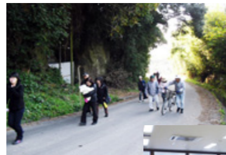
(左) 避難訓練の様子