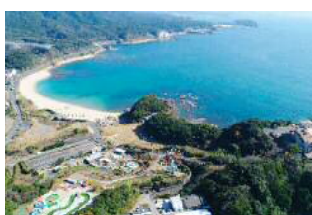
志布志湾を一望！ダグリ岬公園をはじめとした観光地整備