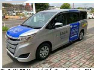
乗合送迎サービス「チョイソコしぶし」などの地域公共交通の確保