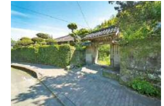
歴史のあるまちづくりへ向けた取組（志布志麓）