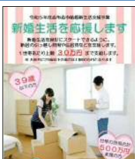
結婚新生活等の若年層支援