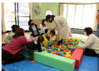
市子育て支援センターでの各種支援