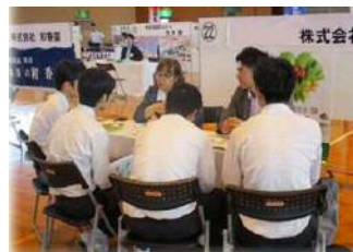
就職合同説明会開催などを通じた各種雇用支援