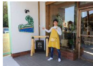
志布志市移住・交流支援センター Esplanade（エスプラネード）中心とした各種支援