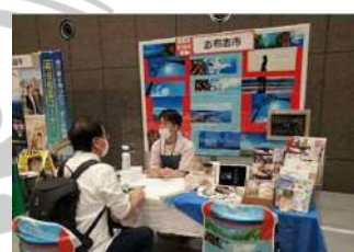
移住イベントへの出展