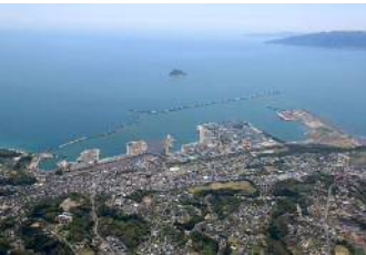
南九州の物流拠点「志布志港」の整備促進