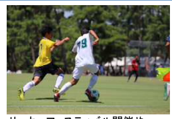
サッカーフェスティバル開催やスポーツ合宿の推進