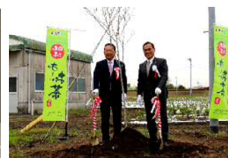
官民連携の取組推進