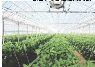
市農業公社などでの新規就農支援