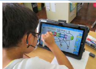
デジタル教科書の導入