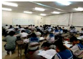
土曜教室（志学教室）の開催