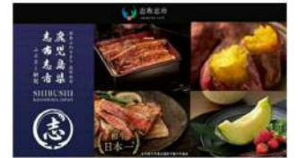
ふるさと納税を通じた特産品振興