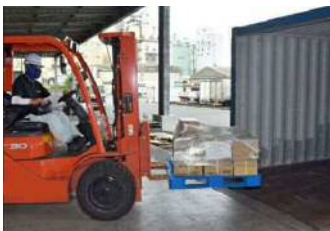
農林水産物・食品などの輸出支援