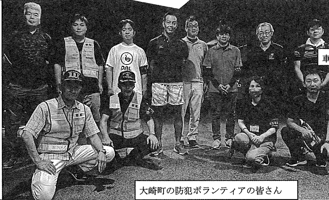
大崎町の防犯ボランティアの皆さん

祭り終了後、大崎町の防犯 ボランティアや学校の先生方 が会場周辺や横瀬海岸、アス パル大崎、くにの松原キャン プ場、コンビニなどの見廻りを実 施しました。