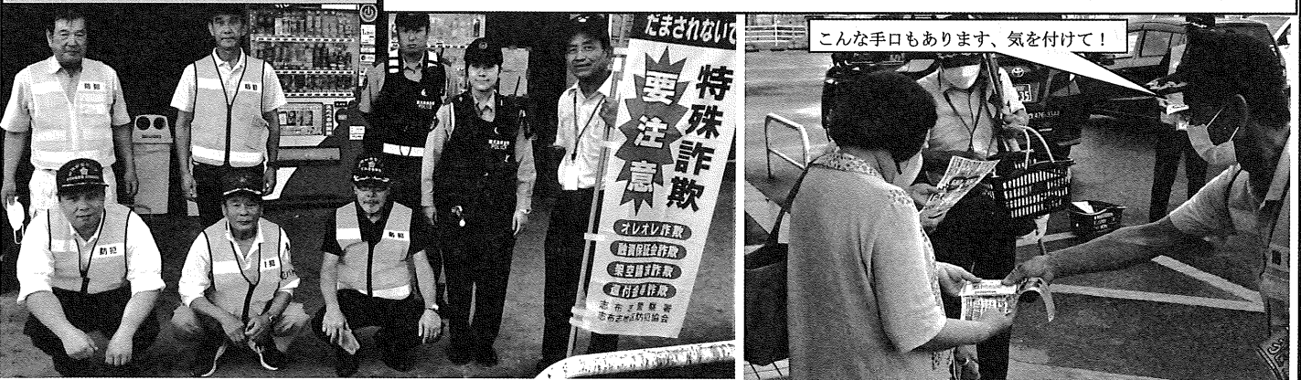
こんな手口もあります、気を付けて！