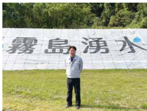
▲お話しいただいた加世田工場長