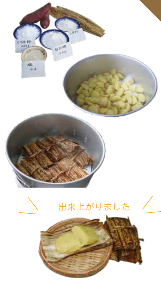
出来上がりました

市生活研究グループでは、農山漁村で暮らす人々が自分たちの生活を豊かにするために、生活の中で生み出した「生活の知恵(旬の食材の保存方法や、便利な道具の開発など)」を研究し、伝承しています。このコーナーをご覧いただき、ぜひ皆さんの日々の生活にご活用ください。 ■ 問い合わせ先： ☎ 農政畜産課 農政係 TEL 474-1111 (内線 427)