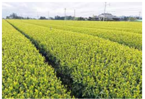
◀ 有機茶研究会のほ場