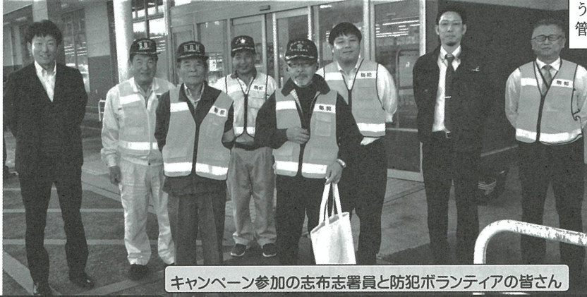
キャンペーン参加の志布志署員と防犯ボランティアの皆さん

12月15日の年金支給日に志布志署員が「うそ電話詐欺被害防止」キャンペーンをJAそ鹿児島大崎支店、鹿児島銀行大崎支店、鹿児島相互信用金庫大崎支店で実施しました。 その後、だいわ大崎店に移動し、防犯ボランティアも加わり、同様のキャンペーンを実施しました。