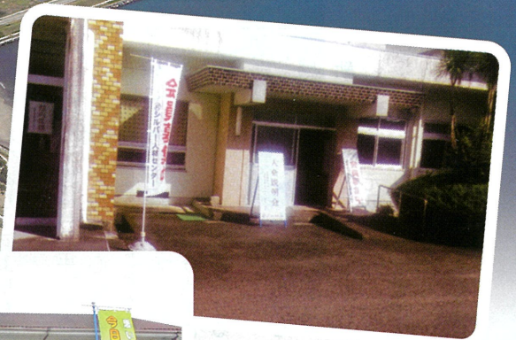
松山地域入会説明会 (毎月第3水曜日・ 老人福祉センター)