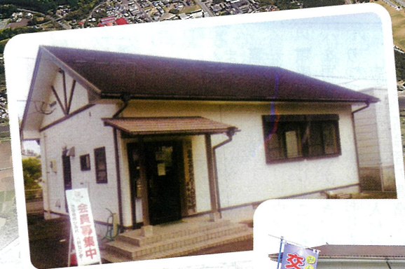
志布志支所 (毎週金曜日常駐)