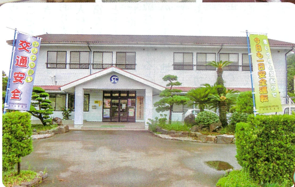
シルバー人材センター本所