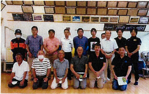
竜門コミュニティ協議会