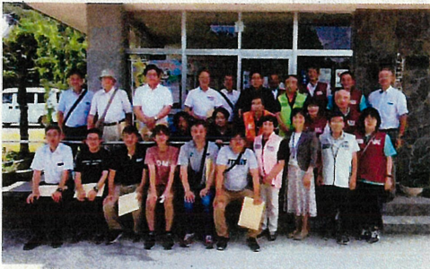
可愛地区コミュニティ協議会