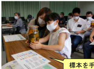
標本を手に興味津々！

講師の窪先生の経歴を簡単に紹介します。 《写真家》南日本写真展「 けんち 県知事賞」「 みなみにほんしんぶん 南日本新聞社賞」、九州二科会写真部公募展「 しやう フォトピア賞」受賞 《環境保全活動》 ごみの不法投棄防止活動 ゴミの不法投棄防止活動、 かんきょう 環境写真展「 ごみたちの叫び ゴミたちの叫び」開催、 らせいぶつ 外来生物の生息・ せいそく 生育調査及び せいでん 駆除活動、 しぶし 志布志市 せいぶつたようせい 生物多様性地域戦略作成委員 その他 その他多くの活動をされています。