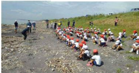
宮原前館長、熱く語られます！