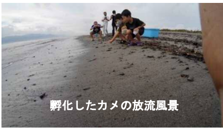
孵化したカメの放流風景