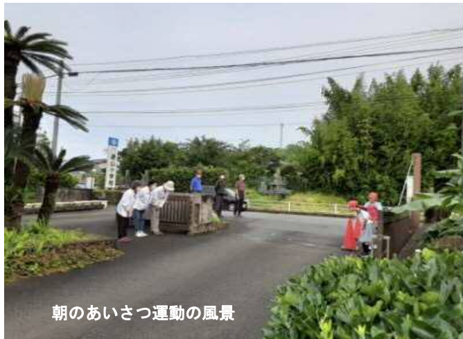
朝のあいさつ運動の風景

はっこう を発行することになりました。校区の皆様のご意見、ご要望をお聞きしながらより良い広報誌にしていきたいと思っ かさ きょうざいかい かつどう こうく みなさま きょうりよく ふ かけつ みなさま りかい ています。重ねて、コミュニティ協議会の活動には校区の皆様のご協力が不可欠です。どうか、皆様のご理解と きょうりよく ご協力をよろしくお願いいたします。