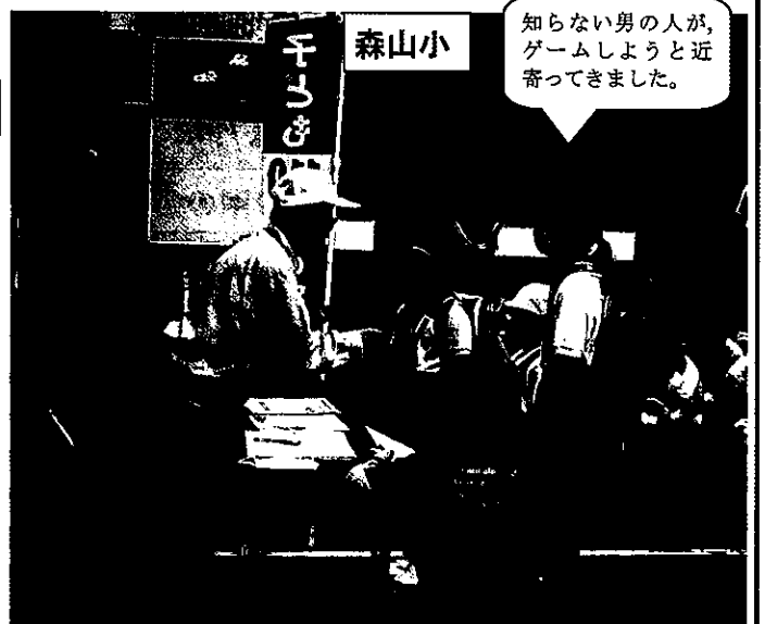
知らない男の人が、ゲームしようと近寄ってきました。