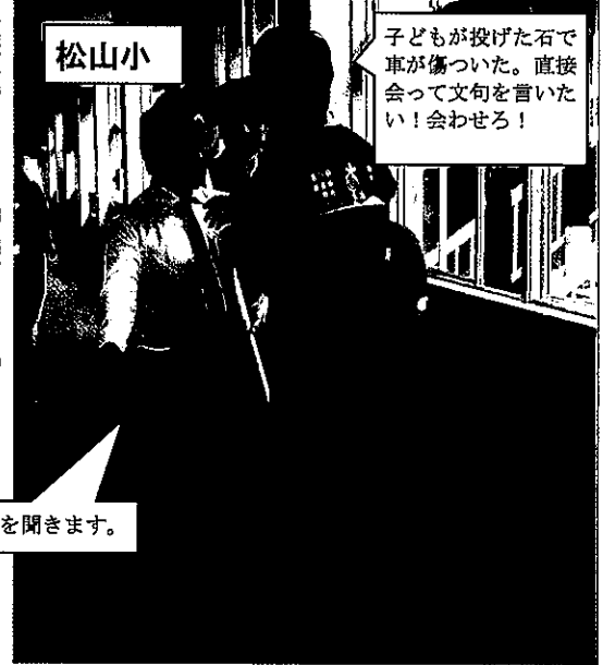
校長室で話を聞きます。