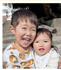
ゆいど 結乙ちゃん(4歳)・こはなちゃん(1歳) 志布志町志布志