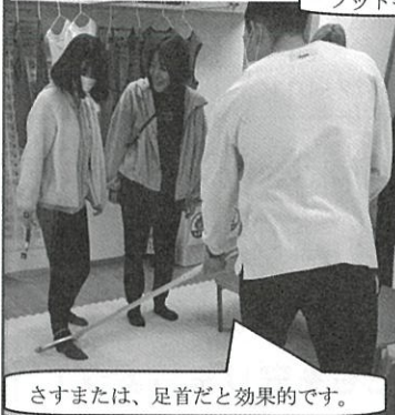
さすまたは、足首だと効果的です。