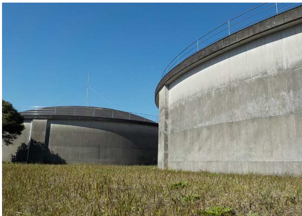
中央地域 大迫配水池