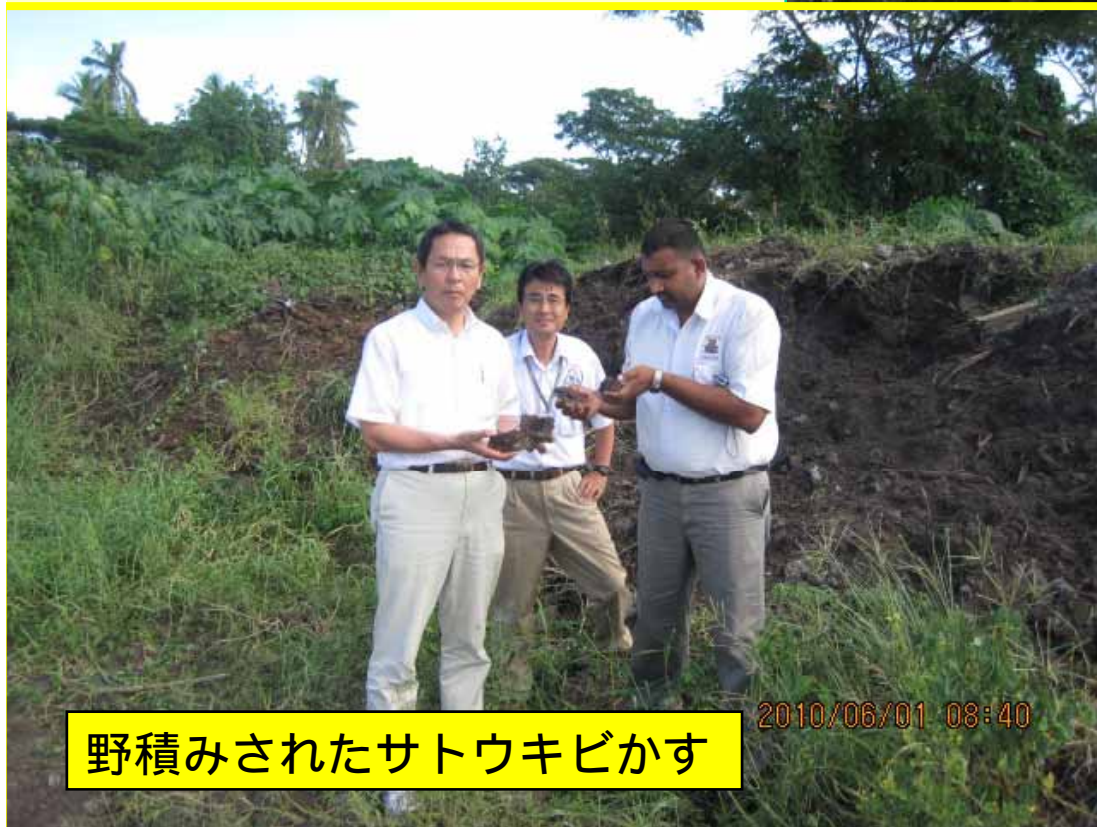
野積みされたサトウキビかす