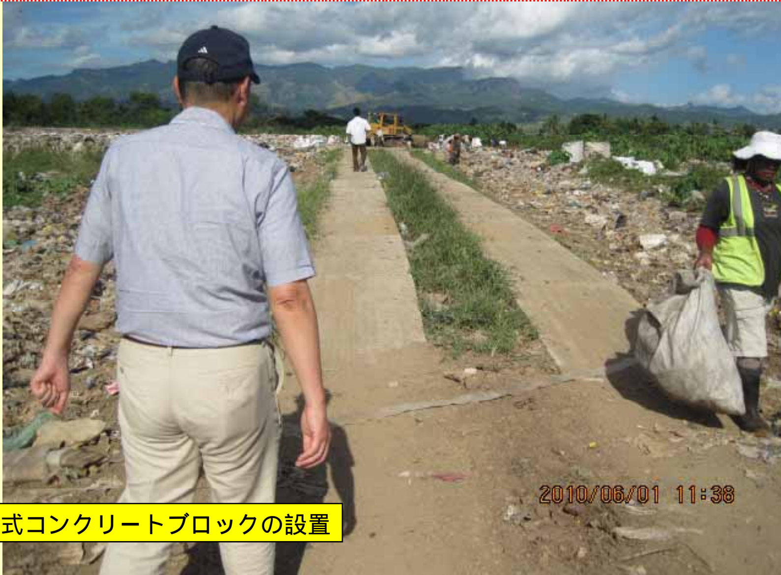
移動式コンクリートブロックの設置