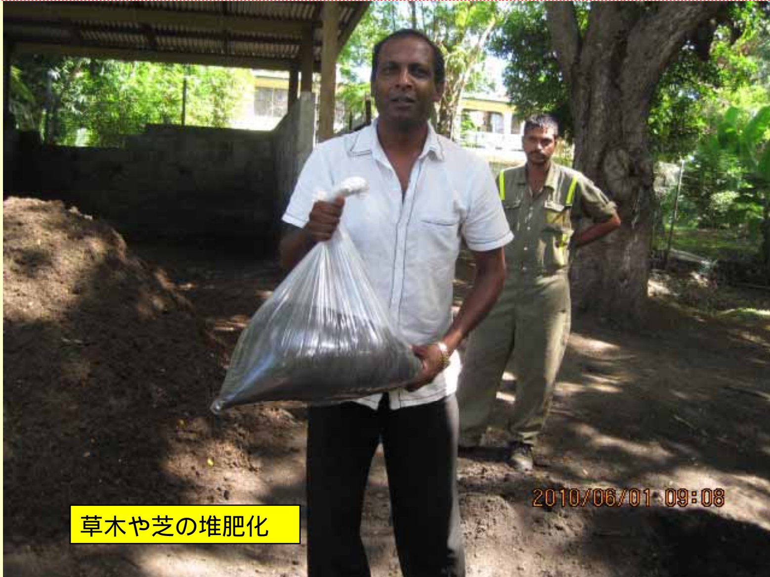
草木や芝の堆肥化