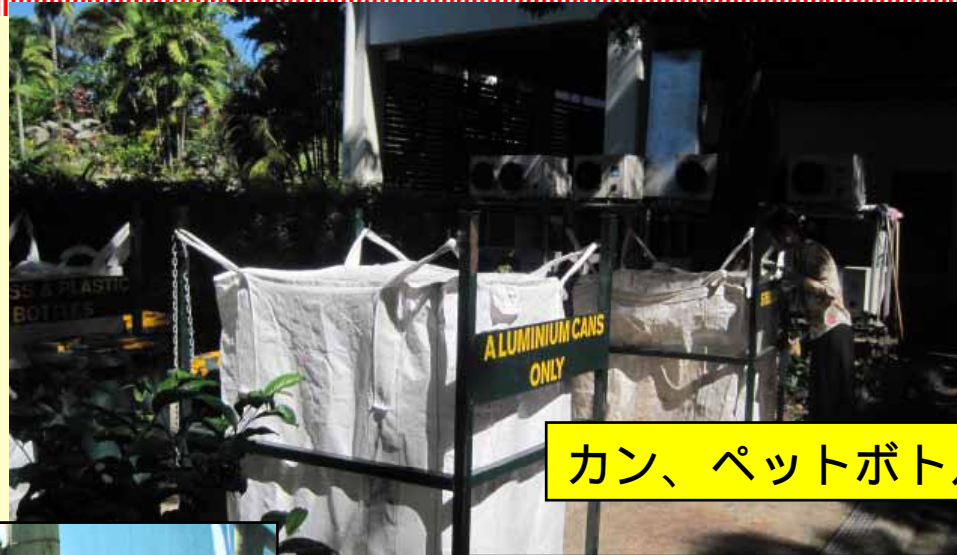
カン、ペットボトルなどを分別