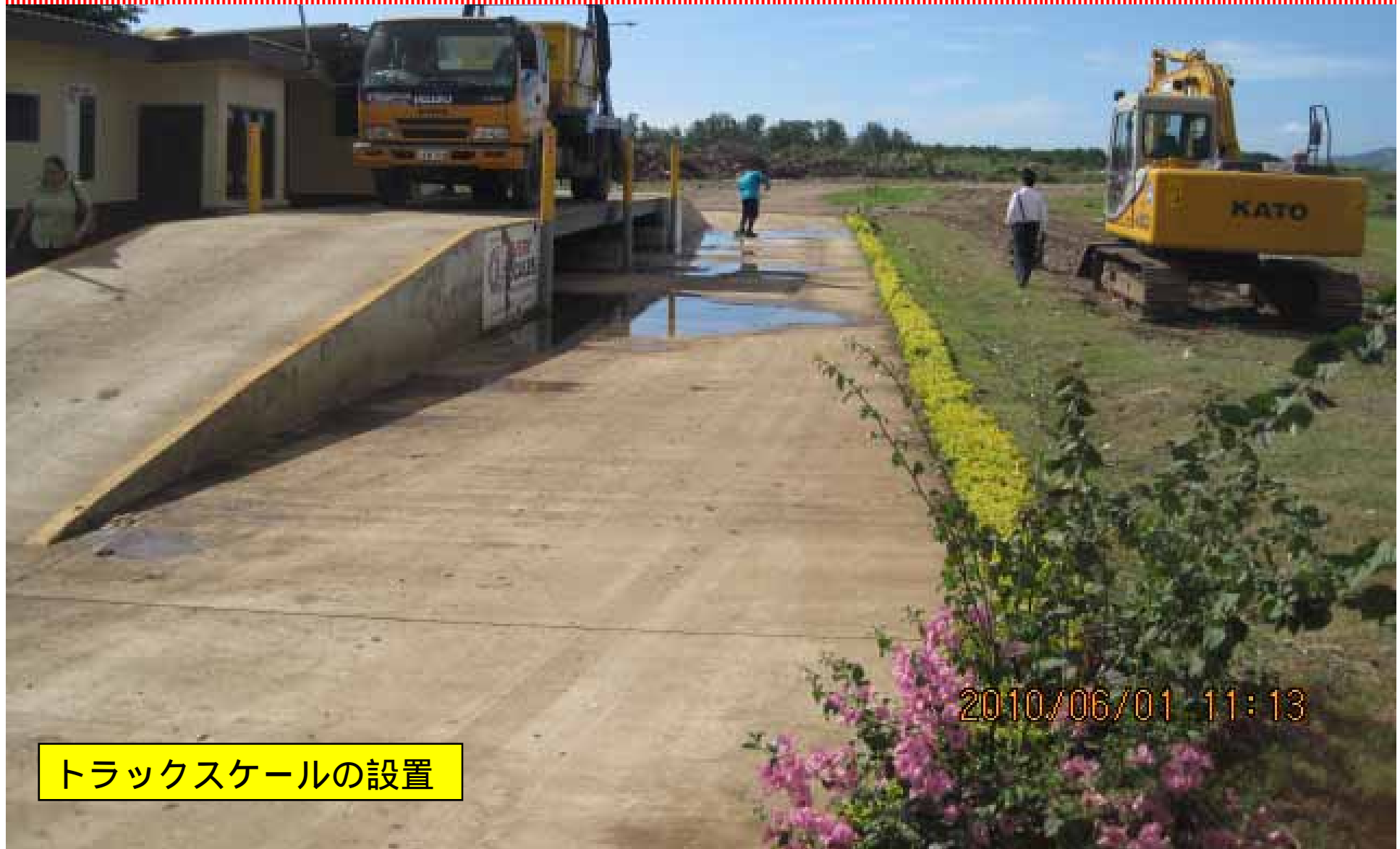
トラックスケールの設置