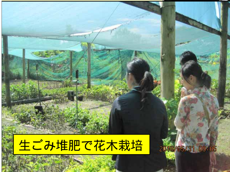
生ごみ堆肥で花木栽培