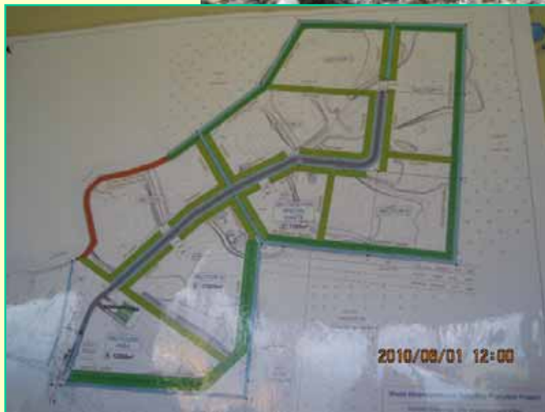
埋立場所の区割り