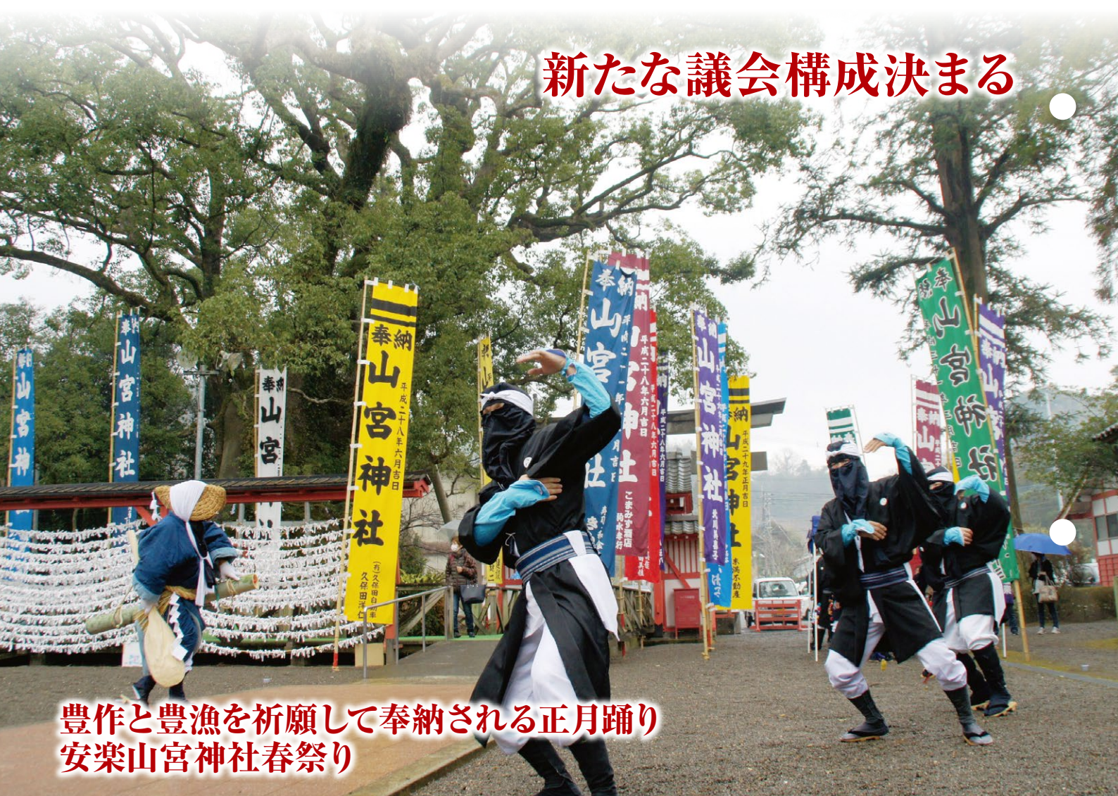
豊作と豊漁を祈願して奉納される正月踊り 安楽山宮神社春祭り