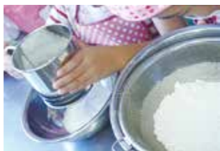
②、③ 粉類、砂糖をふるう