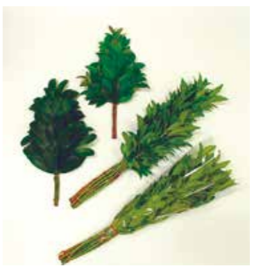
シキミ (写真右下) サカキ (写真左) ヒサカキ (写真上)

また、シキミやサカキ、ヒサカキといった枝物は、お盆やお彼岸といった季節にはもちろんのこと、一年を通して安定した出荷ができます。