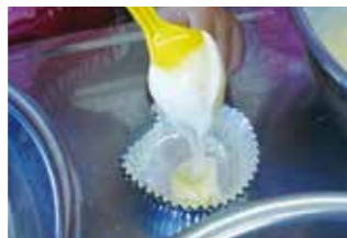
⑤ スプーンで流し込む

⑤④をアルミカップの八分目までスプーンで流し込み、上に飾りのレーズンをのせる。(アルミカップが弱い場合は二枚重ねにするとうまい)