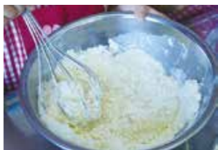
④ 酢と水を加えて混ぜる

⑤④をアルミカップの八分目までスプーンで流し込み、上に飾りのレーズンをのせる。(アルミカップが弱い場合は二枚重ねにするとうまい)