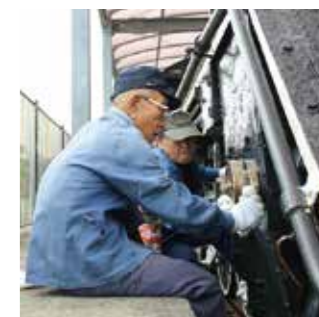
「SL保存活動 40周年 ~鉄道記念公園~」

9月15日(火)、志布志市SL保存会の皆さんが、鉄道記念公園に保存、展示されているSL C58112号機の整備、清掃を行いました。このSLは、昭和50年の最終運行後40年間、同会員の皆さんの手で整備されてきました。この日も整備後のSLは、ピカピカに磨かれ、当時と変わらぬ雄姿を見せてくれました。