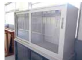
譲渡する学校備品等の一部