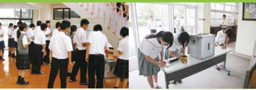
尚志館高校での投票の様子 志布志高校での投票の様子 公職選挙法改正による選挙権18歳引下げが実施されることもあり、生徒さんたちは投票の練習もかねて、自分のお気に入りのデザインに投票してくれました。