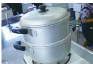
① 蒸し器の準備をする