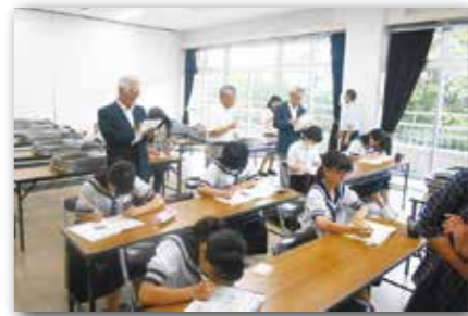
外部評価委員による「志学教室（文化会館）」の視察

地方教育行政の組織及び運営に関する法律第26条の規定に基づき、志布志市教育委員会では5人の学識経験者で構成する外部評価委員会を7月4日に開催し、平成26年度の教育委員会の主な事務事業について点検及び評価を行い、報告書を議会に提出しましたので、その概要を公表します。