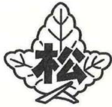
松山小学校校章 (昭和 27 年制定)